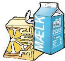
Juice- & Mælkekartoner