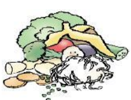
Frugt & Grøntsager