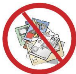
Aviser, Reklamer & Papir