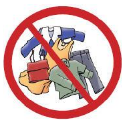
Tøj, Dyner & Lagner