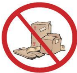
Pap & Pizzabakker